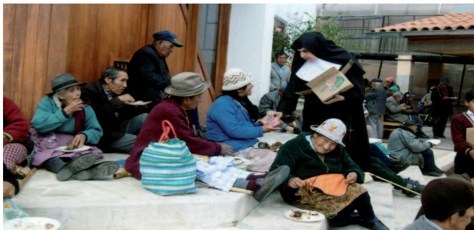
Mit den Schwestern unterwegs: Pause während eines Ausflugs.