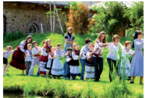
Ukraine: Jugendarbeit muss auch Spaß machen. Mit den Schwestern von der Heiligen Familie ist das kein Problem.

Maria von den Engeln bei Canelones / Uruguay müssen die 14 kontemplativen Schwestern frieren. Die meisten sind älter als achtzig Jahre, manche sogar über neunzig. Ihre kleinen Arbeiten reichen nicht aus, die notwendigen Reparaturen in dem nie wirklich fertiggestellten Kloster und die Heizung zu bezahlen. Auf das Gebet aber sollen und dürfen sie nicht verzichten. Das ist ihr wichtigster Beitrag für die Kirche in dem stark laizistischen Land. Wir haben 18.500 Euro Hilfe zugesagt. ●