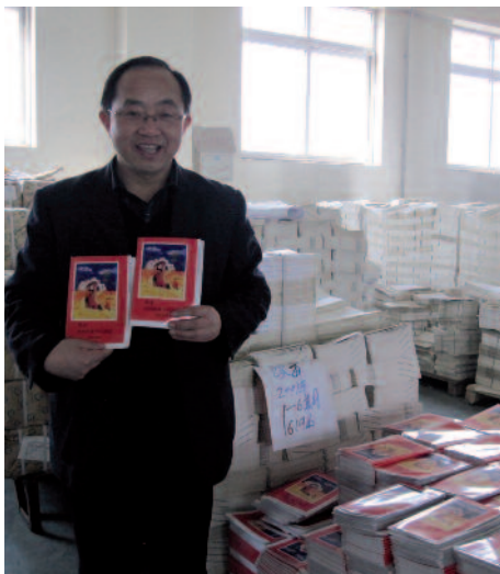
Endlich da: Auch in China freut man sich über die Bibel.