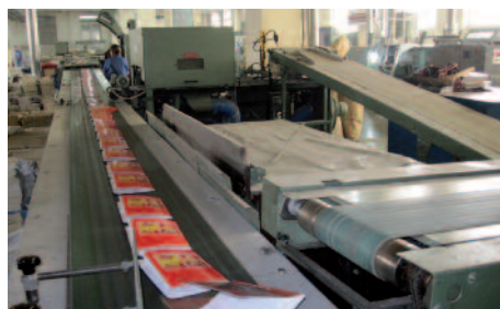
Geht hinaus in alle Welt: die gleiche Botschaft, aber modernere Mittel.