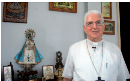
Setzt große Hoffnungen in die Gottesmutter: Erzbischof D. Garcia Ibanez.

Die Verehrung nimmt zu. Alljährlich pilgern mindestens eine halbe Million Menschen zum Nationalheiligtum in Cobre. Und seit anderthalb Jahren “besucht” das nur 30 Zentimeter große Gnadenbild aus Anlass seines Fundes vor vierhundert Jahren alle Diözesen der Insel. Gefunden wurde es von den eingeborenen Zwillingenbrüdern