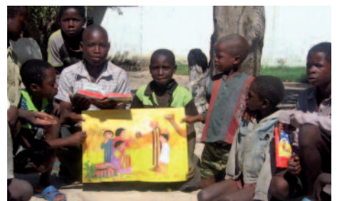
Lebendige Geschichten: So kommt die Botschaft überall an.