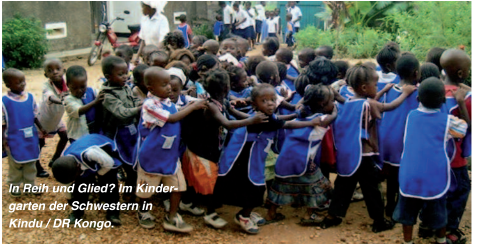
In Reih und Glied? Im Kindergarten der Schwestern in Kindu / DR Kongo.