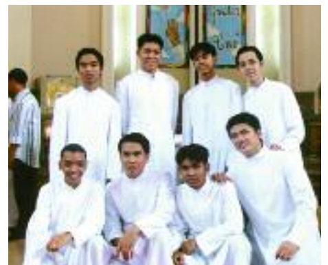
Philippinen: Achtmal Hoffnung für die Kirche.