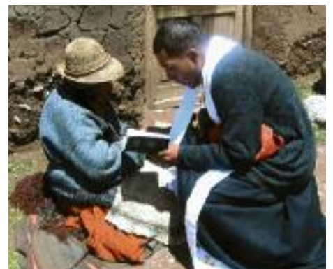
Trost nach dem Beben. Zuspruch für ein Opfer.