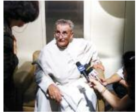
Freund der Medien: Pater Werenfried war ein gefragter Gesprächspartner.

da wo das Wort Gottes sonst kaum hin- kommt. “Radio Veritas”, das in diesem April 40 Jahre alt wurde und der einzige katholische Sender ist, der einen ganzen Kontinent abdeckt, schafft es. In 15 Sprachen strahlt er seine Programme aus in Steppen, Wüsten- und Dschungelgebiete. Für Millionen Menschen ist dieser Sender, dessen Zentrale auf den Philippinen ist, die einzige Quelle wahrer Information. Seit seinem Beginn unterstützen wir seine Arbeit, ohne Eure Großzügigkeit wäre er längst verstummt. Gleiches gilt für das katholische Radio in Litauen . Sein Katechismus-Programm “Ich will glauben” gehört mittlerweile zu den populärsten Sendungen im Land. “Es ist die Reinheit des Herzens, die sehend macht”, schreibt Benedikt XVI. in seinem Buch “Jesus von Nazareth”. Helfen wir dem Heiligen Vater, der uns ausdrück-