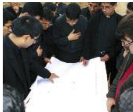
Die Pläne für ein Seminar genau studieren: Die Erde in Peru bebte häufig.