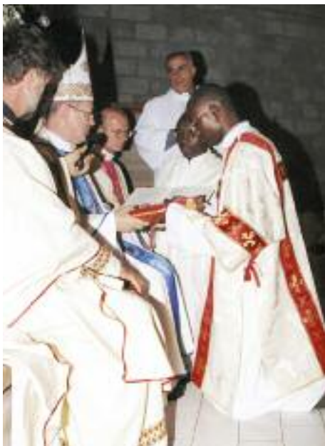
Weihe in Kamerun: "Du bist Priester auf ewig..."

für den Klerus – die Welteinkehrtage für Priester statt. Gepredigt werden sie vom Wiener Erzbischof Christoph Kardinal Schönborn und ihr Leitmotiv lautet: "Für das Heil der Welt zum Priester geweiht: