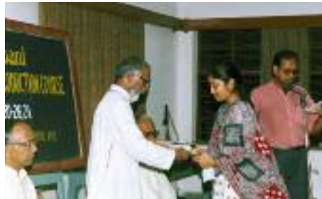
Schreiben lernen, um besser zu sprechen: Workshop bei “Radio Veritas”.