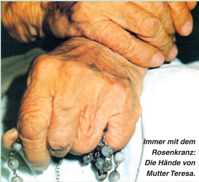
Immer mit dem Rosenkranz: Die Hände von Mutter Teresa.

“Was mich betrifft, will ich öffentlich erklären, dass ich es dem Rosenkranzgebete verdanke, wenn ich in den Stürmen, die auch mein Priesterleben heimsuchten und erschütterten, keinen Schiffbruch erlitten und den Glauben bewahrt habe.”