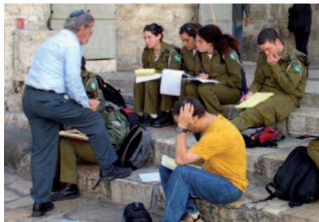
Jerusalemer Zentrum in Aktion: Unterricht auch für Soldaten.