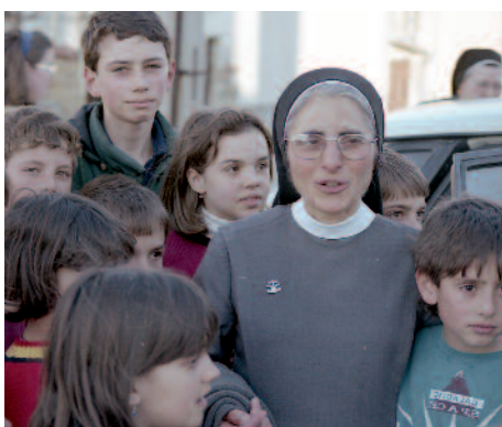
Ohne Schwestern geht es nicht: Franziskanerin mit Kindern in Plovdiv.

len Stühle im Konferenzraum, es fehlt ein Tisch im Speiseraum. In den Zimmern der Mönche fehlen zudem einfache Schränke. Die "Unbeschuhten Karmeliter des Heiligen Josef" sind Entbehrungen gewohnt. Die Schwestern, die die Zeit der Diktaturen überlebt haben, auch, und dasselbe gilt für die Laien. Am schmerzlichsten vermisst haben sie Priester. Ohne Priester keine Sakramente. Jetzt hat Gott ihnen einen jungen Priester geschenkt. Es ist gleichsam eine Aufforderung an uns, den tapferen Brüdern und Schwestern in Bulgarien mit einem Funken Großzügigkeit ein Stück hoffnungsfrohe Zukunft zu spenden. ●