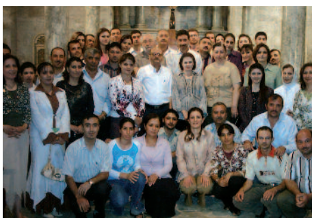
Glaube vereint – wenn man ihn kennt: Ein Bibelkurs in Mossul / Irak.

meinsamen Perspektive, um Kultur, Glaube, Geschichte und Gebräuche der Anderen kennen zu lernen und so ein Netzwerk all derjenigen zu etablieren, die einen dauerhaften Frieden wünschen. Nur so bleibt die Hoffnung – und bleiben auch die Christen in der Region.