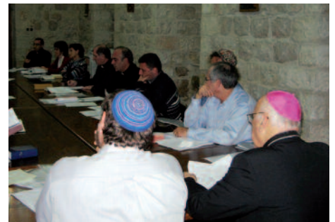
Zuerst den anderen kennen lernen: Kreuz und Thora, Pileolus und Kippa.