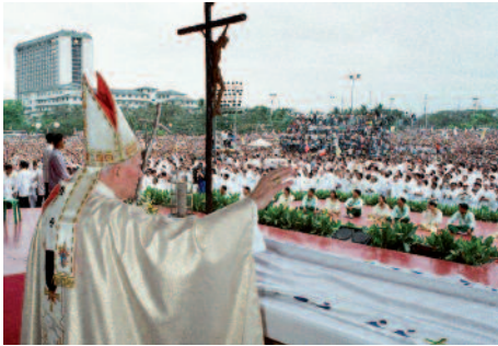
Die “größte” Heilige Messe: Johannes Paul II. in Manila mit fünf Millionen.