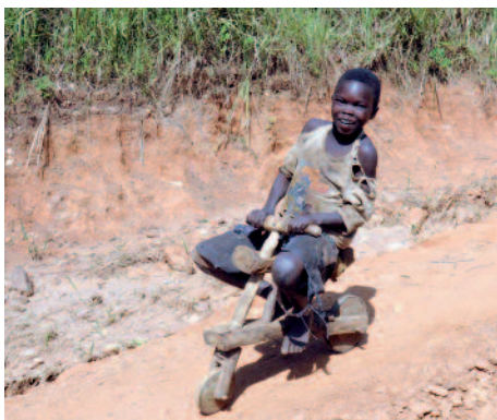
Im Flüchtlingslager: Kleiner Erfinder auf selbstgebautem Fahrrad.

Uganda ist ein Land mit Zukunft. Zum Nationalheiligtum der Märtyrer in Namugongo pilgern jährlich hunderttausende, allein am Festtag Anfang Juni waren es mehr als eine halbe Million. Sie fürchten Krieg, Tod und Blutvergießen. Aber sie wissen auch: Der Glaube überwindet die Furcht, er macht froh, inmitten des Kriegs und trotz der Armut. Ein Zeichen der Zuversicht in die Zukunft sind die vielen Kinder. Sie prägen das Bild in der Sonntagsmesse und auf den Straßen. Auch in den Flüchtlingslagern trotzen sie dem Elend Hoffnung ab. Die meisten Kleinen wissen nicht, dass Ihr sie dabei begleitet, angefangen bei der Flüchtlingshilfe bis hin zur Existenzhilfe für Seminare. Ihr seid unsichtbar dabei – so wie die Märtyrer. Bleibt den Christen in Uganda treu!