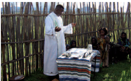
“Kleine” Heilige Messe in Äthiopien: Alle Messen sind unendlich viel wert.

1 241 564 Messen wurden im vergangenen Jahr in Euren Anliegen gelesen. Das sind 3402 pro Tag. Alle 24 Sekunden begann irgendwo auf der Welt eine Heilige Messe für Euch.