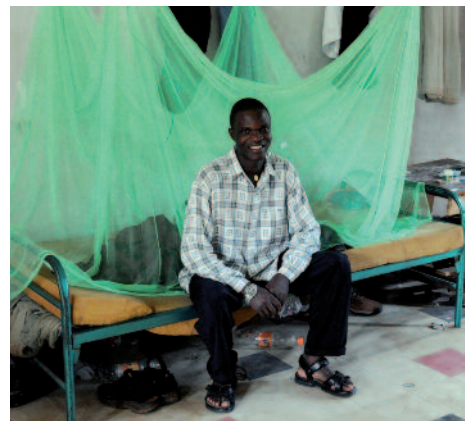
Im Seminar: Kaum Habe, aber umso mehr Hoffnung und Freude.

Gott Euch sicher wieder heimführen. Unsere Gebete sind immer auf Euren Wegen."