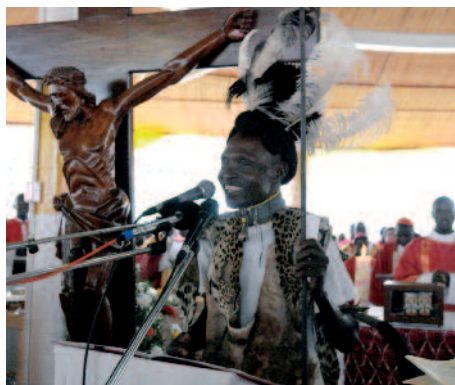
Festtag der Märtyrer: Ein Stammesältester liest traditionelle Gebete.