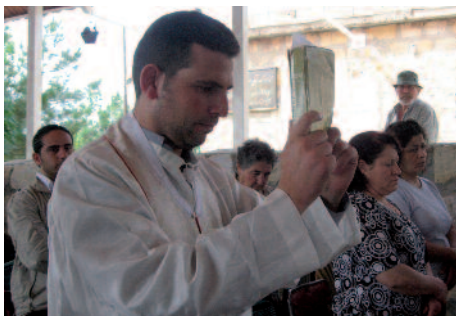
Festhalten am Wort Gottes: Christen in Lattakia / Syrien.