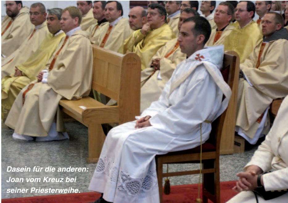
Dasein für die anderen: Joan vom Kreuz bei seiner Priesterweihe.