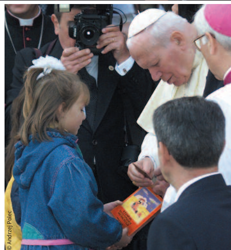
Kasachstan, September 2001: Ein Kind zeigt Johannes Paul II. seine Bibel auf Kasachisch.

Nach vierzig Jahren gibt es nun 51 188 209 Exemplare in 191 Sprachen (Stand Juni 2019). Und das ist nicht das Ende. Täglich kommen neue Bestellungen und Anfragen aus aller Welt. Viele Pfarren, Diözesen oder Orden sind zu arm, um selbst die Druckkosten zu zahlen: zum Beispiel die sieben Di-