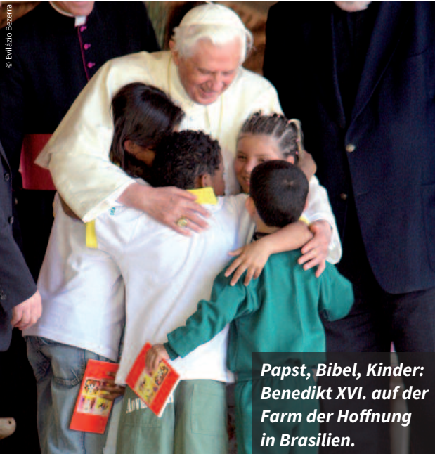
Papst, Bibel, Kinder: Benedikt XVI. auf der Farm der Hoffnung in Brasilien.