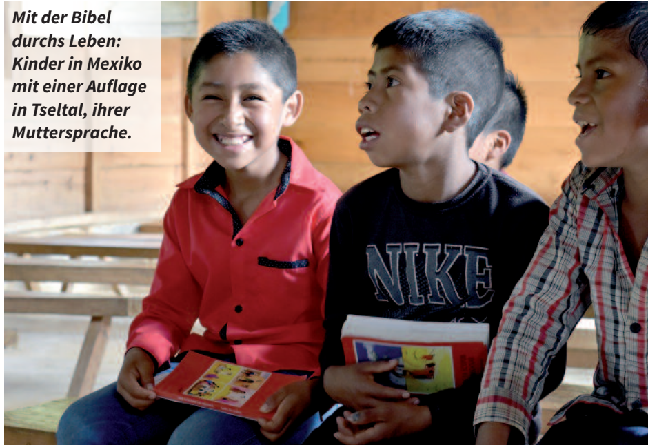
Mit der Bibel durchs Leben: Kinder in Mexiko mit einer Auflage in Tselta, ihrer Muttersprache.