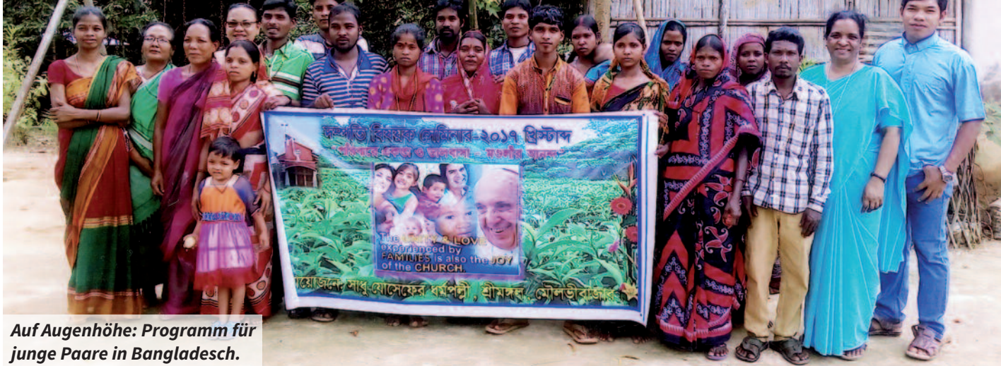
Auf Augenhöhe: Programm für junge Paare in Bangladesch.

„Gott selbst ist Urheber der Ehe“, heißt es in „Gaudium et Spes“ (1965), und Benedikt XVI. sagte: „Das Sakrament der Ehe ist keine Erfindung der Kirche, sondern es ist wirklich mit dem Menschen als solchem mit-geschaffen worden, als Frucht der Liebe, in der Mann und Frau einander finden und so auch den Schöpfer finden, der sie zur Liebe berufen hat“.