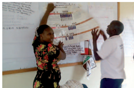
Kenia: vereint gegen Aids und für eheliches Glück.

Familien in Kisumu nach dem göttlichen Plan leben können“. Das Programm ist eine Neuauflage. Wegen Geldmangels konnte es jahrelang nicht weitergeführt werden, und sofort waren die Opferzahlen wieder gestiegen. Jetzt werden Paare mit dem entsprechenden Fachwissen ausgebildet, das sie dann in den 45 Pfarren weiter verbreiten sollen. Ziel ist es, innerhalb eines Jahres 380 Paare auszubilden. Wir helfen Erzbischof Philip und seinem Team mit 14.500 Euro .