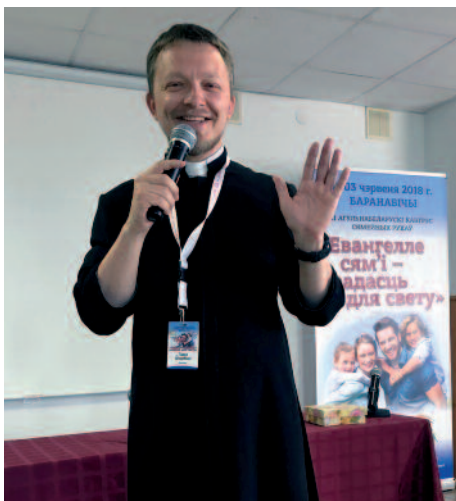
Weißrussland: gemeinsam mit der Kirche zur Stärkung der Familie.

In den Ländern der ehemaligen Sowjetunion kämpft die Kirche mit den Folgen des menschenverachtenden Kommunismus. Abtreibung ist gängiges Mittel der Geburtenkontrolle, der Drogenkonsum und die Selbstmordrate auch unter jungen Leuten steigen. Die Kommission für Ehe und Familie der Bischofskonferenz in Weißrussland hat deshalb das Jahr 2019 zum Jahr der Familie ausgerufen, um die Familie als Mutter, Vater und Kinder zu unterstützen. Sie tut es konkret mit Seminaren, Geburtsvorbereitungskursen und psychotherapeutischen Angeboten. Auch besondere Exerzitien und ein Kongress der Familienbewegungen stehen auf dem Programm. Dort stärken wir den Kampf für die heilbringende Wahrheit von Ehe und Familie mit 7.000 Euro .