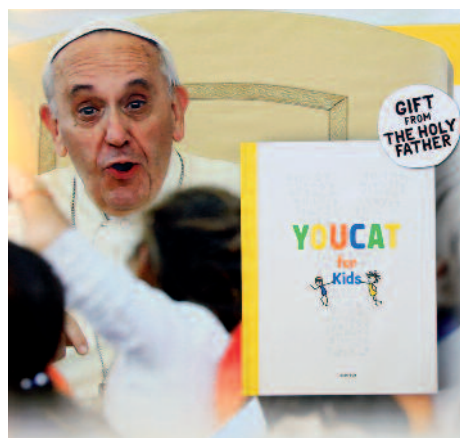
Herzensanliegen des Papstes: die Kinderbibel und der YOUCAT for Kids.