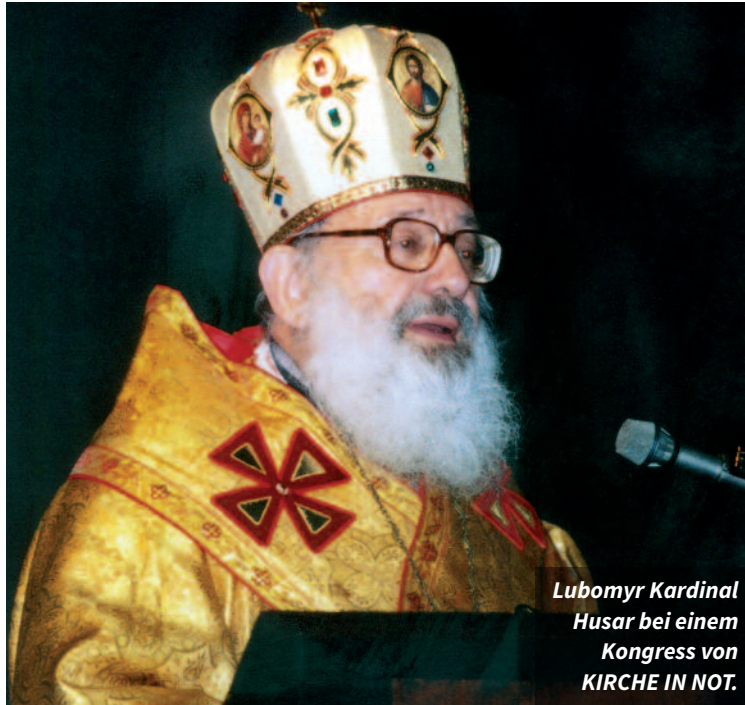
Lubomyr Kardinal Husar bei einem Kongress von KIRCHE IN NOT.