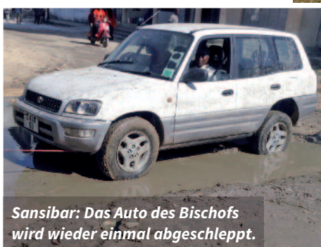
Sansibar: Das Auto des Bischofs wird wieder einmal abgeschleppt.

Wir möchten ihm mit 29.500 Euro helfen, ein geländegängiges Fahrzeug zu erwerben, mit dem er sicher ans Ziel kommt.