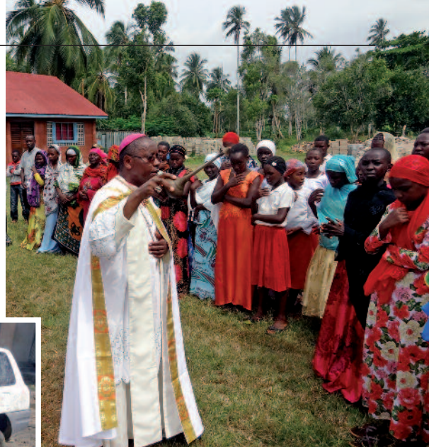
Der gute Hirte: immer bei seiner Herde.

Die Ordensfrauen, die in das Gebiet kamen, sprachen zunächst nicht über ihren Glauben, sondern vergruben in den Dörfern heimlich Marienmedaillen und Kruzifixe, um den katholischen Glauben symbolisch „einzupflanzen“, und beteten darum, dass er Wurzeln schlagen und sich ausbreiten möge. Ihr Gebet und ihr