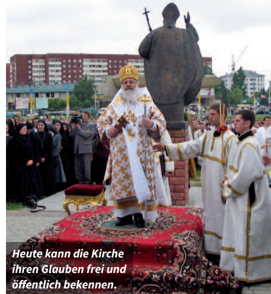
Heute kann die Kirche ihren Glauben frei und öffentlich bekennen.

Dieser große Tag kam 1989, als Michail Gorbatschow nach seiner Begegnung mit Papst Johannes Paul II. im Vatikan die griechisch-katholische Kirche legalisierte. Myroslaw Kardinal Ljubatschiwskyj, ihr damaliges Oberhaupt, kehrte im März 1991 aus dem römischen Exil nach Lemberg zurück. Auch eine Delegation von KIRCHE IN NOT begleitete ihn. Nun wurde jedoch mehr Hilfe gebraucht als je zuvor. KIRCHE IN NOT unterstützte die Kirche in jeder