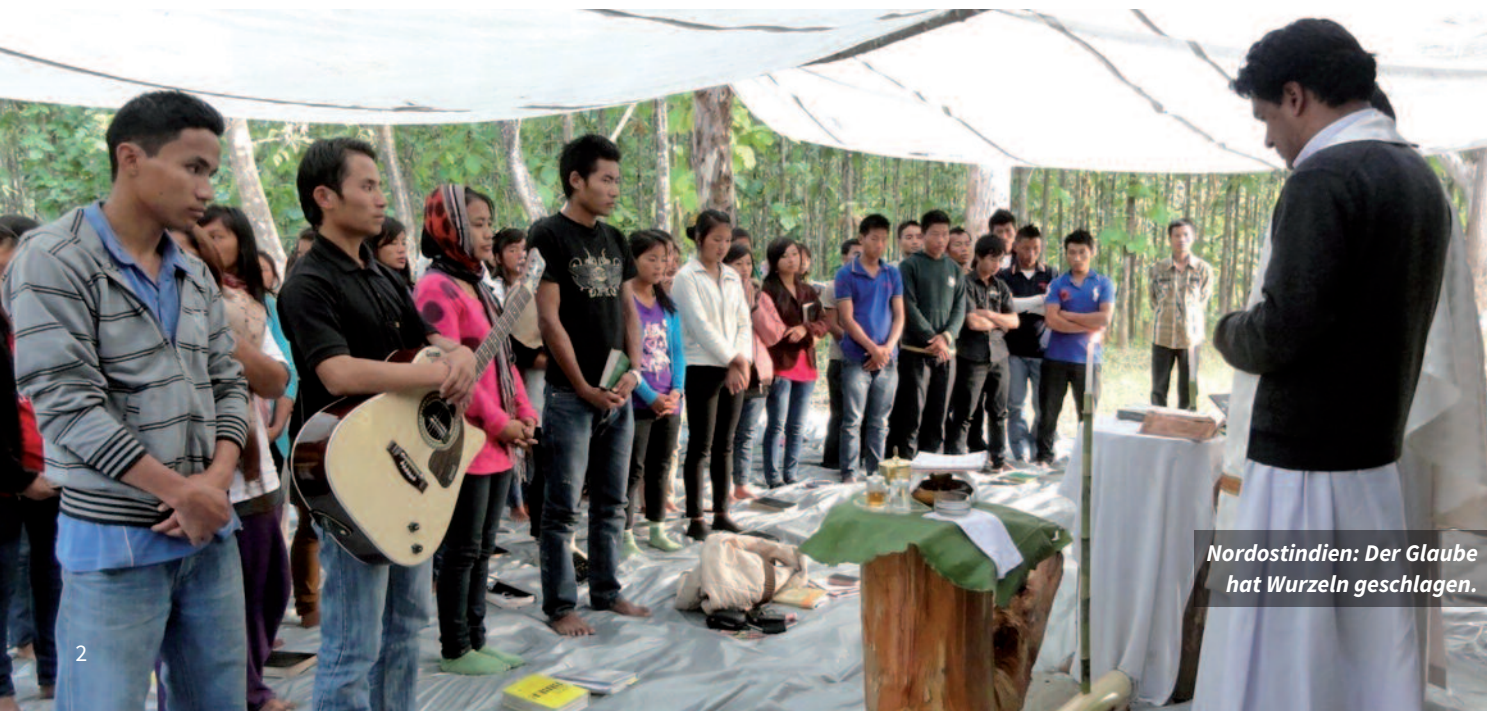
Nordostindien: Der Glaube hat Wurzeln geschlagen.

Die Gläubigen warten auf ihn. Ihm fehlen noch 11.800 Euro für ein neues Auto. Wer hilft mit?